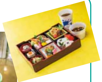
特製弁当・1ドリンク・赤だし付 (写真は一例)