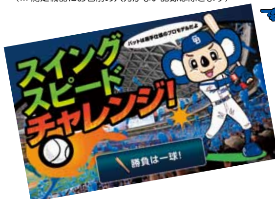
スイングスピードチャレンジ